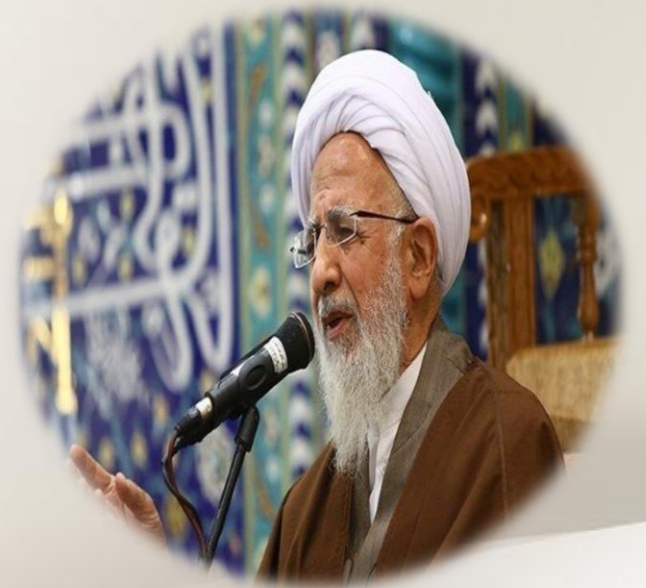
آیت الله جوادی آملی