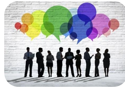
تکنیک های ارتباطی