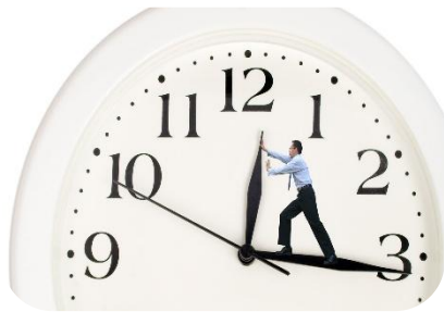
تکنیک های زمانی