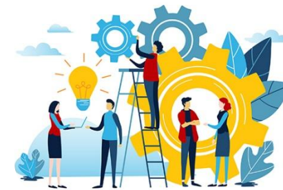
تکنیک های فیزیکی

این نوع از تکنیک‌ها توسط کارمندان اداری و یا کارمندان دورکار مورد استفاده قرار می‌گیرد و می‌توانند در زمینه‌های بسیار گسترده‌ای به کار روند.