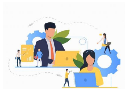
مهارت های اجتماعی